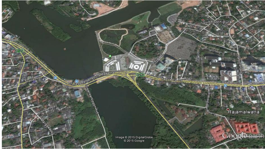
රූප සටහන 01